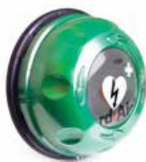
robustní a odolný úložný box na zeď