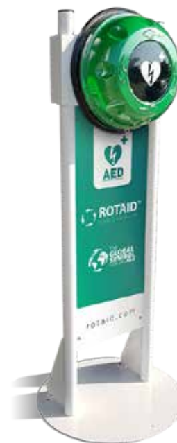
totem pro venkovní instalace