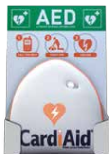
držák na zeď