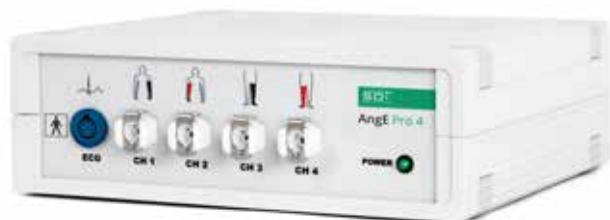
AngE Pro 4

4kanálová simultánní oscilografická pletysmografie