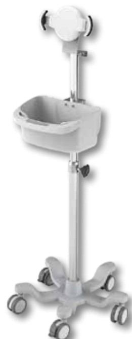
pojízdný stojan IMS-CQ01