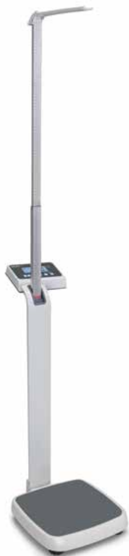
MPE 250K100HM s výškoměrem