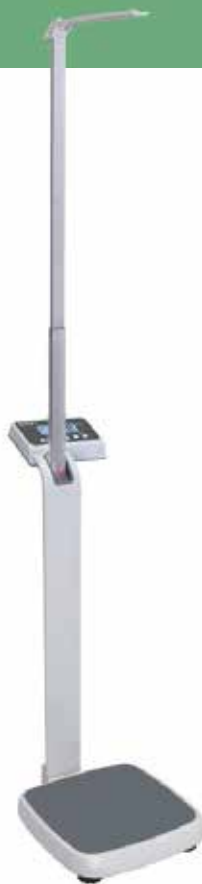
MPE 250K100HM s výškoměrem